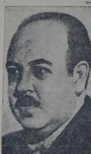
EL MINISTRO DE MEJICO EN LA REPUBLICA ARGENTINA opina que el proyecto presentado por el doctor Antuna a la cámara de representantes del Uruguay es inoportuno y no prosperará

En la política interna de los países no por eso puede negarse a la Liga ni a ninguna otra corporación la facultad de opinar o de exteriorizar una "declaración solemne" para obtener de un gobierno la cesación de un "mal evidente". Se recuerda también que tampoco figura entre los fines expresos de la Liga la protección a determinadas colectividades pero, se agrega a continuación, que existe el antecedente según el cual la Liga protegió a las minorías cristianas de Turquía, al ser expulsadas por Mustafá Kemal.