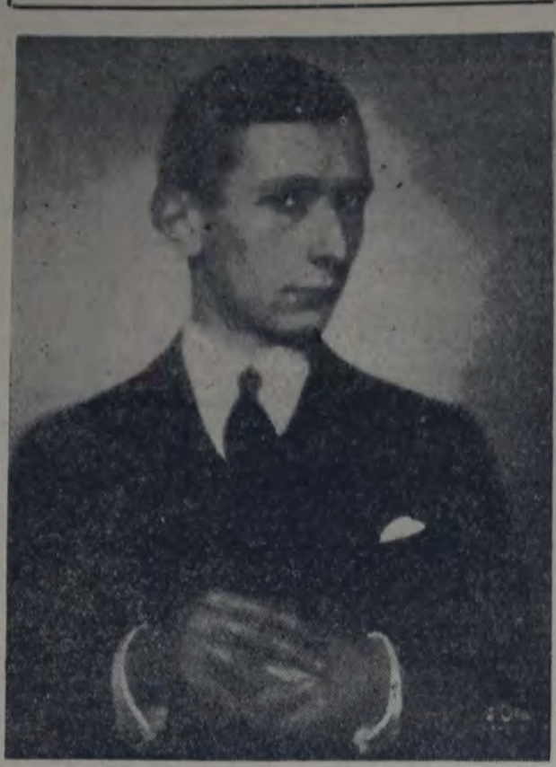
PRECEDIDO DE ENVIDIABLE RE NOMBRE DEBUTARA HOY EN EL Odeón el pianista Alejandro Uninsky