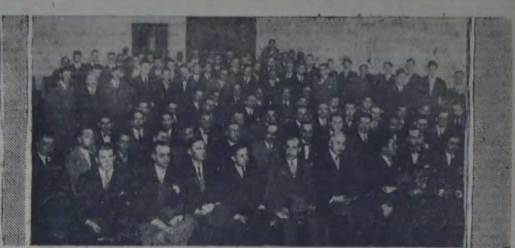
EL COMITE DE HUELGA DE LOS TRABAJADORES DE LA FABRICA DE CAMPOMAR Y SOULAS, RODEADO de algunos compañeros